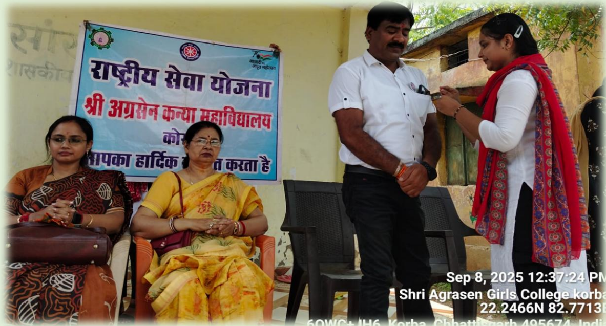
Sep 8, 2025 12:37:24 PM Shri Agrasen Girls College korba 22.2466N 82.7713E 60WC+JH6, Korba, Chhattisgarh 495674, India