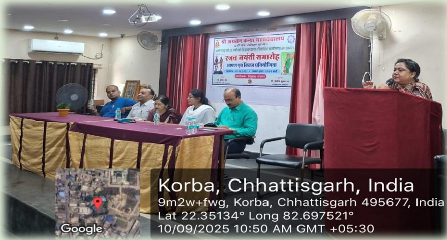
Korba, Chhattisgarh, India 9m2w+fwg, Korba, Chhattisgarh 495677, India Lat 22.35134° Long 82.697521° 10/09/2025 10:50 AM GMT +05:30