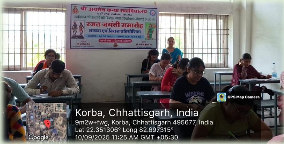
Korba, Chhattisgarh, India 9m2w+fwg, Korba, Chhattisgarh 495677, India Lat 22.351306° Long 82.697315° 10/09/2025 11:25 AM GMT +05:30