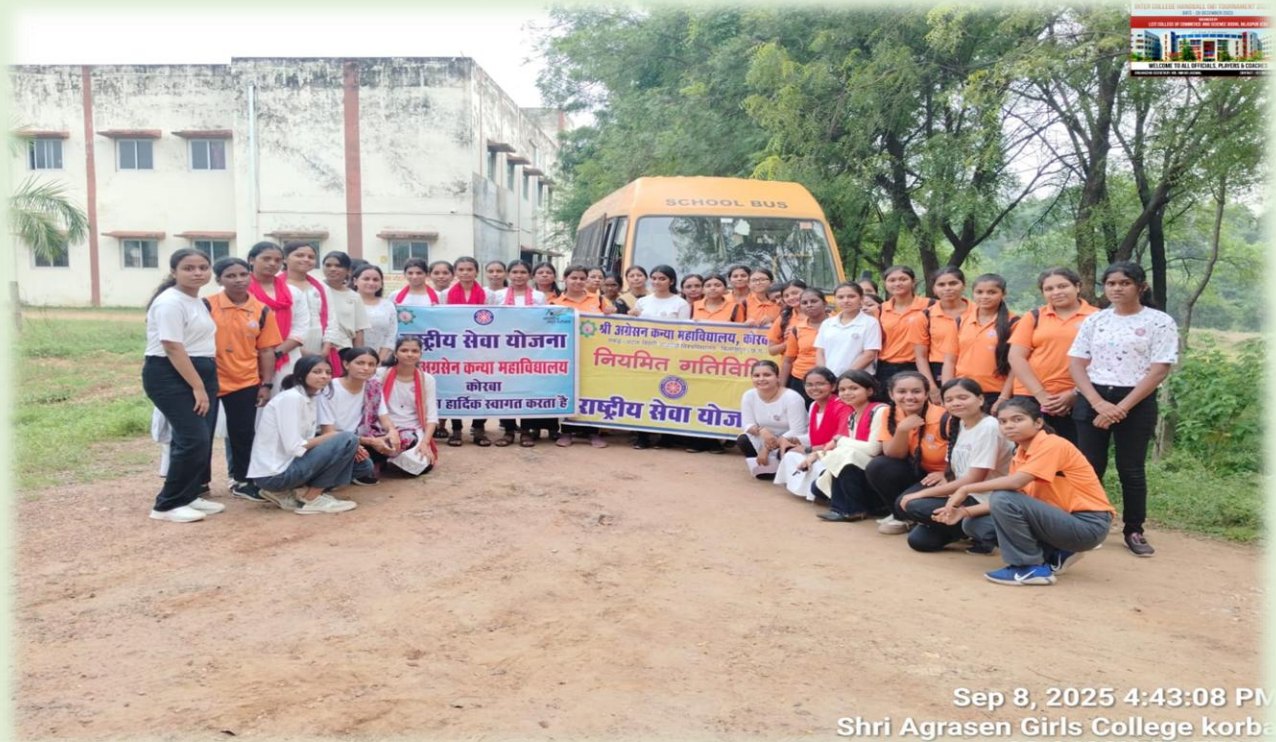
Sep 8, 2025 4:43:08 PM Shri Agrasen Girls College korba 22.2466N 82.7713E