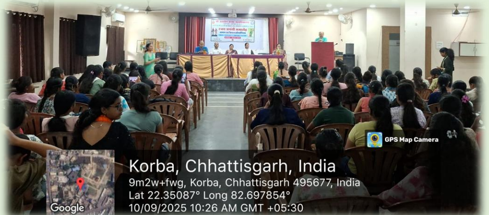
Korba, Chhattisgarh, India 9m2w+fwg, Korba, Chhattisgarh 495677, India Lat 22.35087° Long 82.697854° 10/09/2025 10:26 AM GMT +05:30