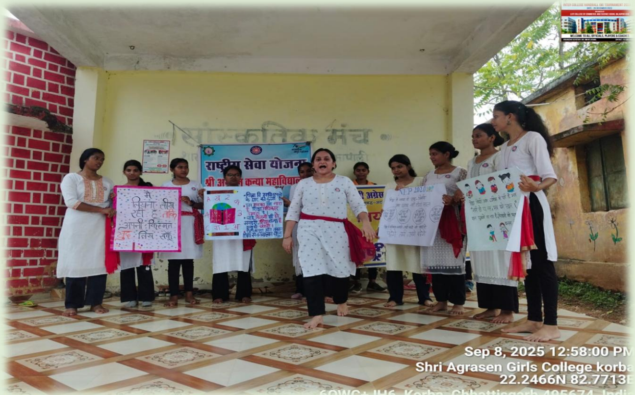
Sep 8, 2025 12:58:00 PM Shri Agrasen Girls College korba 22.2466N 82.7713E 60WC+ JH6, Korba, Chhattisgarh 495674, India