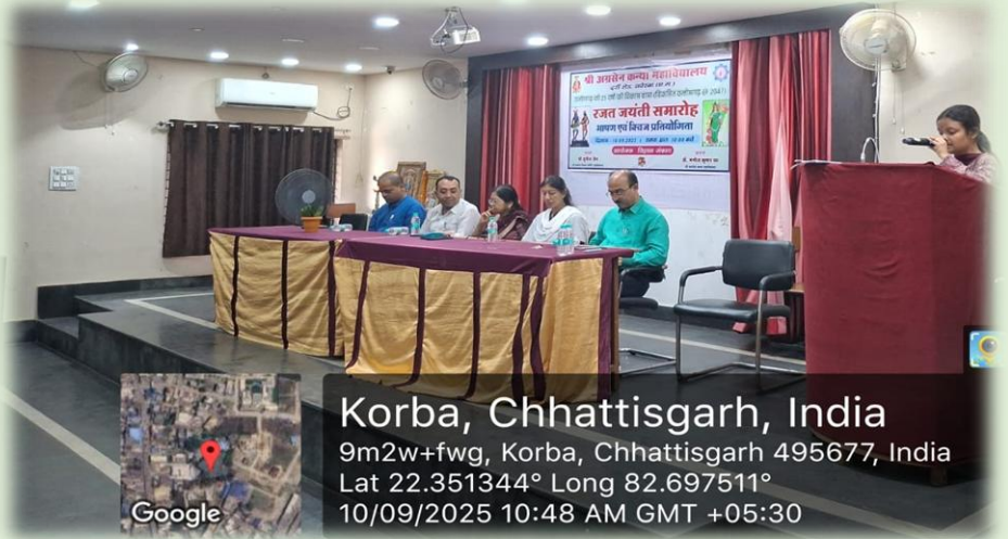
Korba, Chhattisgarh, India 9m2w+fwg, Korba, Chhattisgarh 495677, India Lat 22.351344° Long 82.697511° 10/09/2025 10:48 AM GMT +05:30